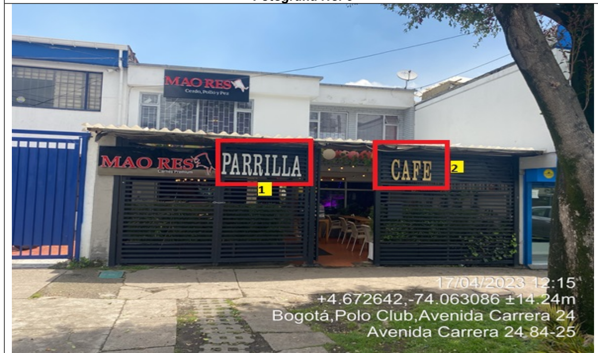
Fotografía No. 5

En la cual se evidencia un (1) elemento tipo aviso en fachada perteneciente al establecimiento comercial "Parrilla", el cual se encuentra superando el antepecho del segundo piso de la edificación.